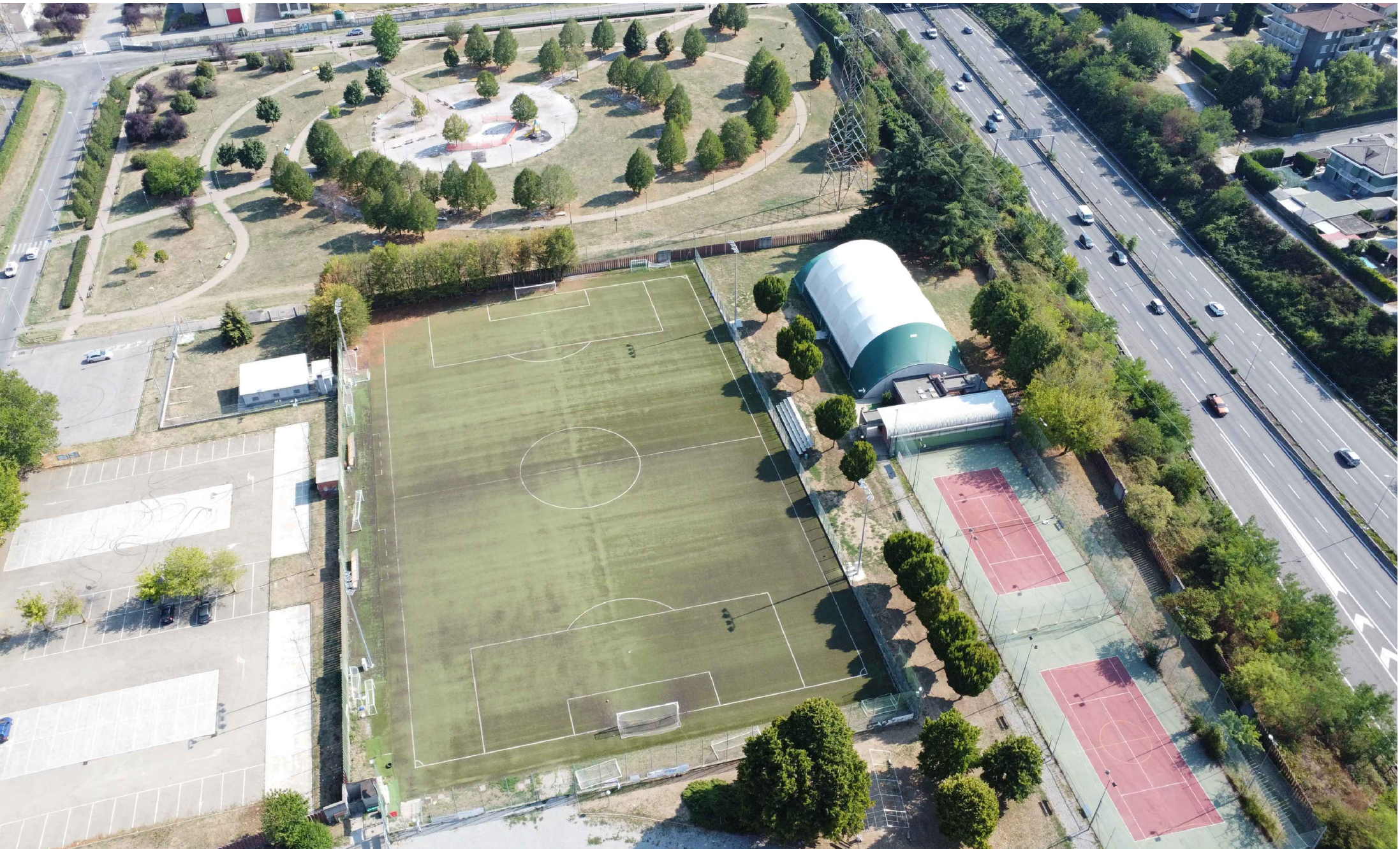
F6_Vista sul campo da calcio, parcheggi, campo da tennis coperto e spogliatoio