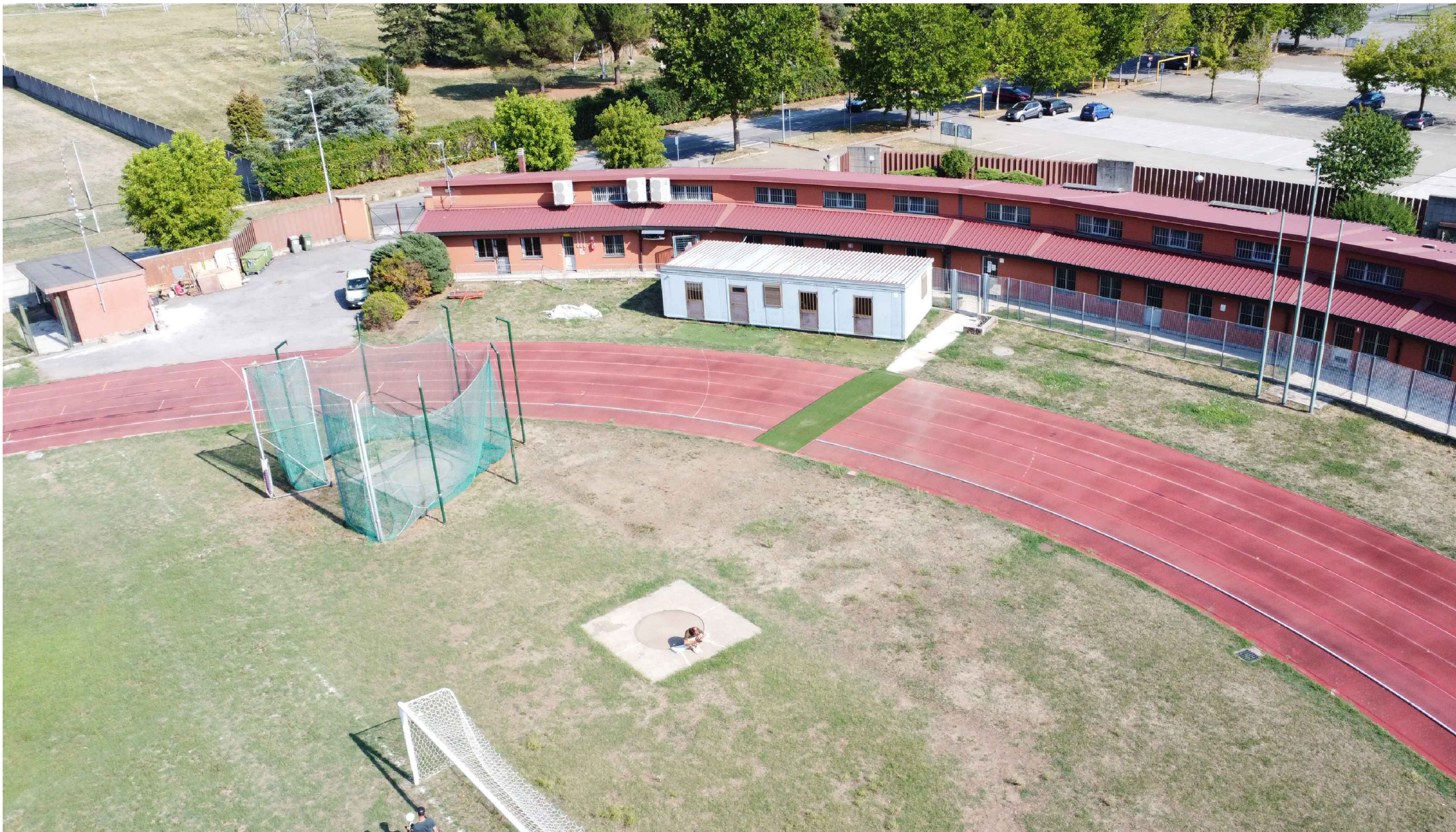
F1_Vista della zona d'ingresso ed edificio polifunzionale