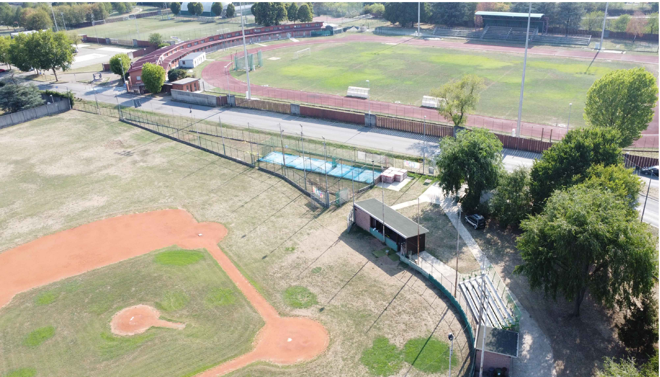
F2_Vista sul campo da baseball