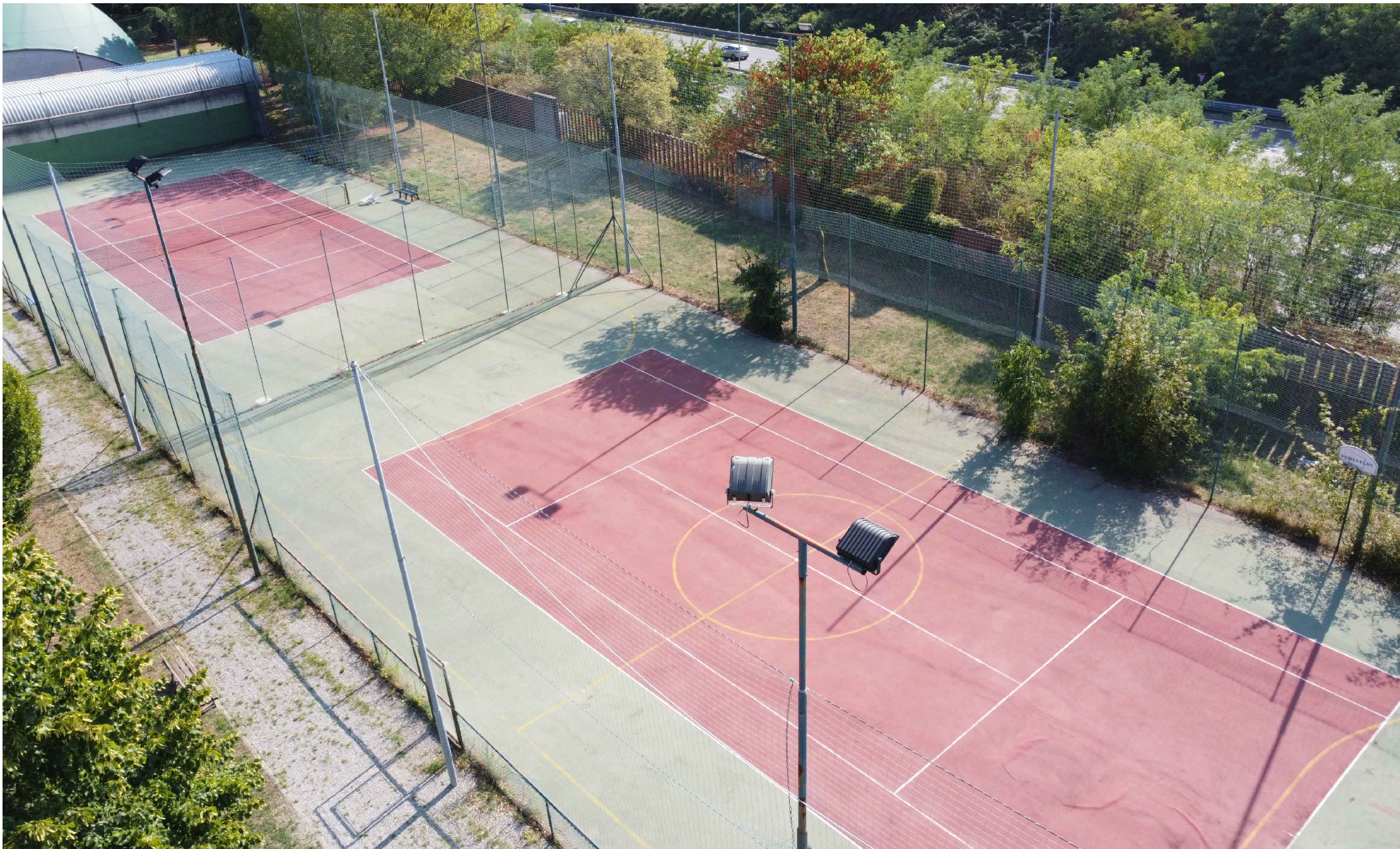
F5_Vista dai campi da tennis scoperti