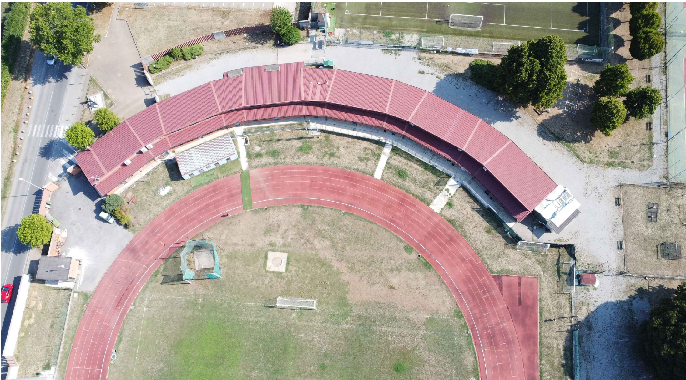
F3_Vista dall'alto dell'edificio principale spogliatoi e altre funzioni